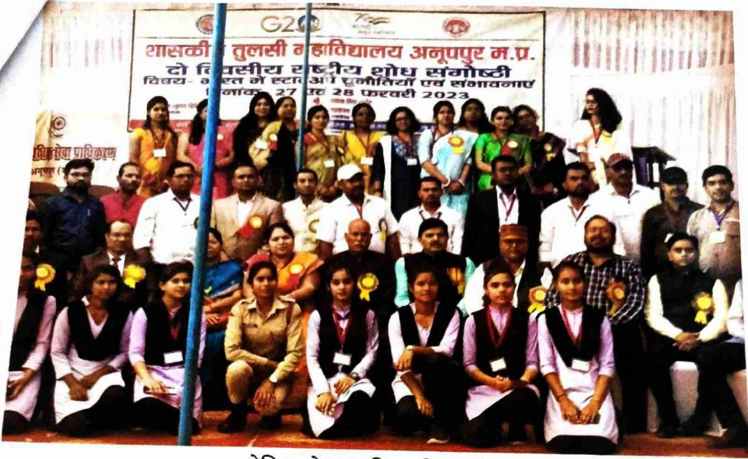
सेमिनार के प्रथम दिवस की ग्रुप फोटो